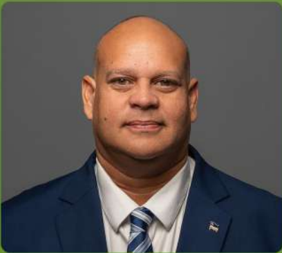
Tyron Boekhoudt Minister di Salubridat, Medio Ambiente i Naturalesa