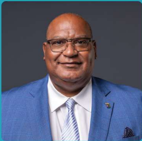
Charles Cooper Minister di Finansa