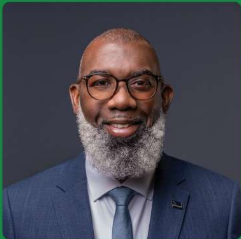
GILMAR PISAS Minister di Asuntunan General Minister-President