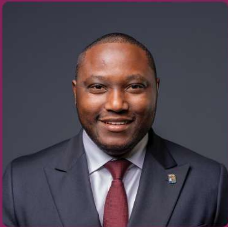
SHALTEN HATO Minister di Maneho di Gobernashon, Planifikashon i Servisio Públiko