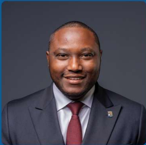
Shalten Hato Minister di Hustisia