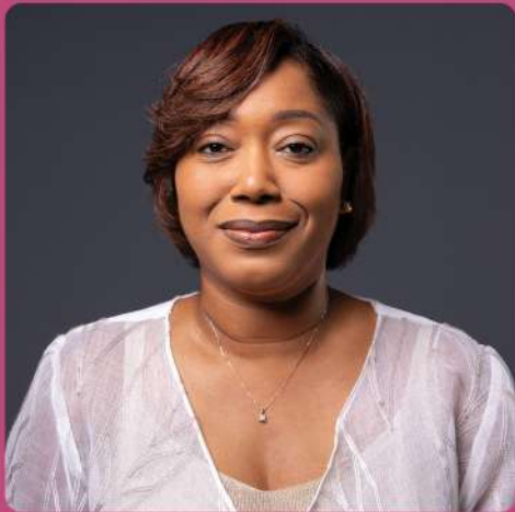
Charetti America-Francisca Minister di Desaroyo Sosial, Labor i Bienestar