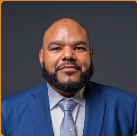
RODERICK MIDDELHOF Minister di Desaroyo Ekonómiko