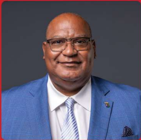
Charles Cooper Minister di Tráfiko, Transporte i Planifikashon Urbano