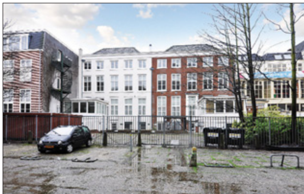
De door Gevolmachtigde minister Marvelyne Wiels na haar aantreden in juni 2013 doorgevoerde reorganisatie binnen het Curaçaohuis, blijkt desastreuze gevolgen te hebben gehad voor het financieel beheer.

Soab schetst een beeld van het Curaçaohuis als een vrijstaat