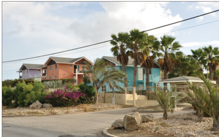
Het luxueuze resort La Privada in Vredenberg.